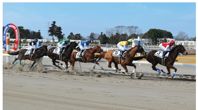
騎手課程(模擬レース)