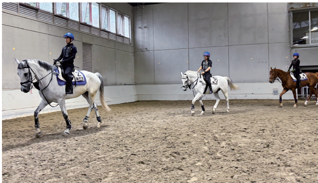
厩務員課程(基本馬術)