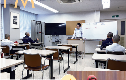
学科授業(騎手課程)