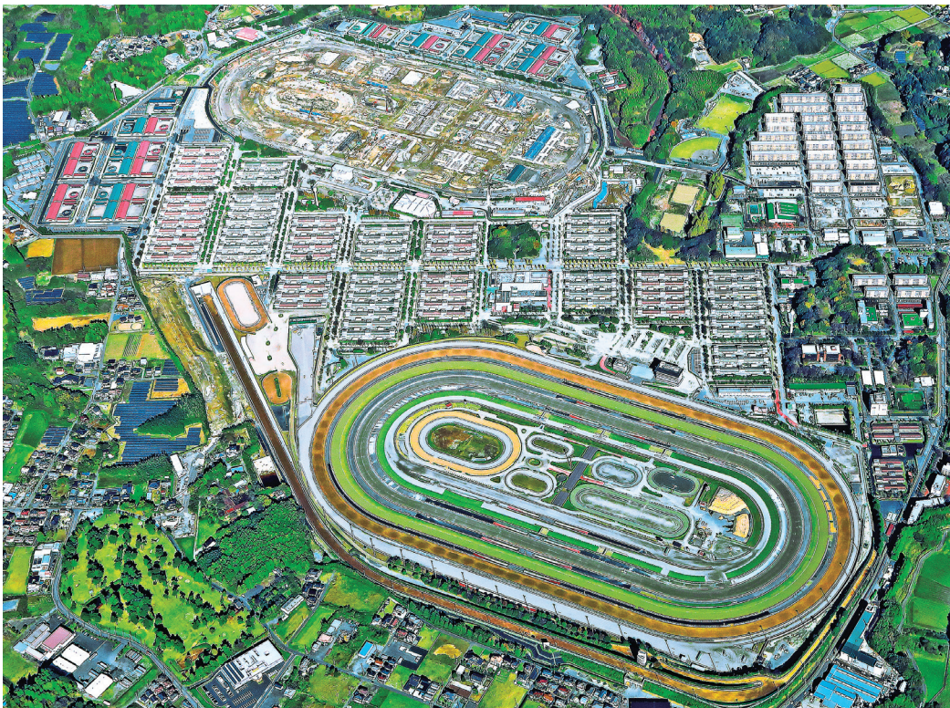
美浦トレーニング・センター