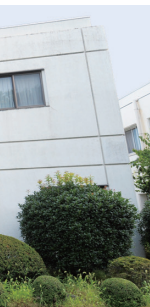
⑭ 厩手課程生徒寄宿舎