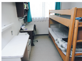
⑬ 生徒の居室(公正寮)