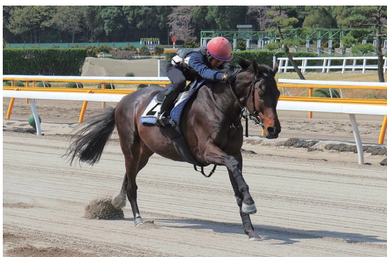
騎手課程(走路騎乗)