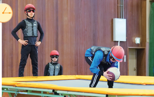
フィジカルトレーニング(騎手課程)