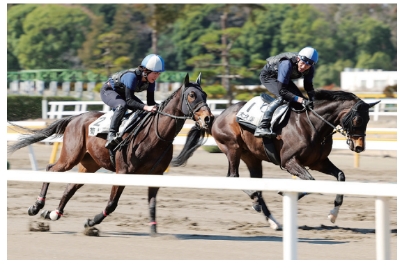
厩務員課程(走路騎乗)