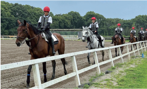
騎手課程 (基本馬術)