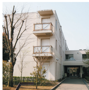
⑭ あかつき寮(厩務員課程生徒寄宿舎)