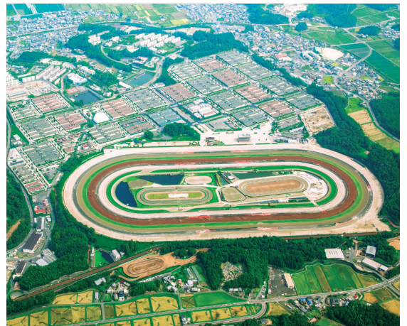
栗東トレーニング・センター

これらのトレーニング・センターは、「公正競馬」の円滑かつ安定的施行、充実したレースの提供などを目的として、昭和44（1969）年には滋賀県の栗東町（現在の栗東市）に、そして昭和53（1978）年には茨城県的美浦村にそれぞれ開設しました。ここには、調教師、騎手、厩務員、調教助手など多くの人々が居住し、競走馬にとって好ましい環境と充実した施設のもと、より“強い馬”をつくりあげるために日々努力しています。