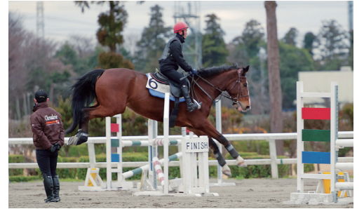
騎手課程 (障害馬術)