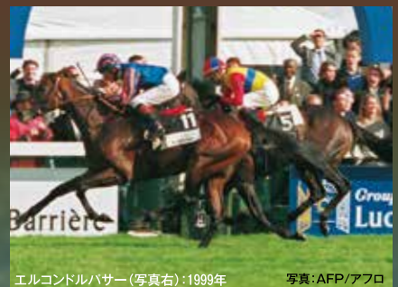
エルコンドルパサー(写真右):1999年

馬券の購入方法、レース視聴方法などは本誌モノクロページおよびJRAホームページにてご確認ください。発走時刻などは変更となる場合があります。変更情報はJRAホームページでご確認ください。