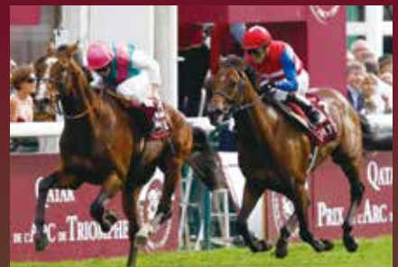
ナカヤマフェスタ(写真右):2010年