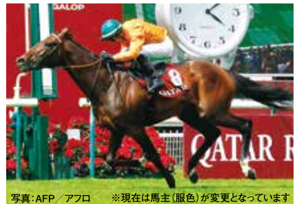
🇫🇷 ルックドゥヴェガ 牡3 通算4戦3勝 24仏ダービー(G1)1着

当コーナーの情報は9月24日時点のものです。出走回避・出走取消などによりレースに出走しない可能性がございます。 当コンテンツの内容においては、JRAが特定の馬の応援や推奨などを行うものではありません。