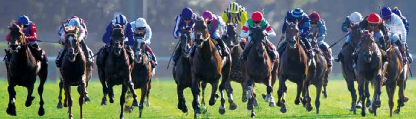
スルーセブンシーズ(右から7頭目、赤帽):2023年