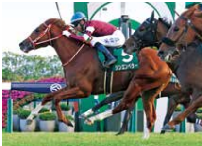
🇯🇵 シンエンペラー 牡3 通算7戦2勝 23ラジオNIKKEI杯京都2歳S(GIII)1着