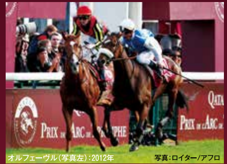
オルフェーヴル(写真左):2012年

※日本調教馬が対象。人気はJRAでの発売(2016年以降)のもの。優勝馬名の前にある国旗は調教国。