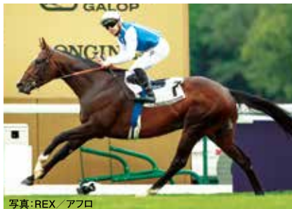
🇫🇷 ソジー 牡3 通算6戦4勝 24パリ大賞(G1)1着