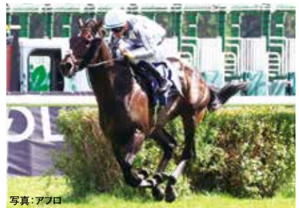
🇮🇪 アルリファー 牡4 通算9戦3勝 24ベルリン大賞などG1・2勝