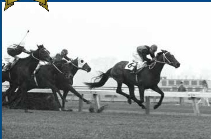
第24回皐月賞 優勝馬 シンザン