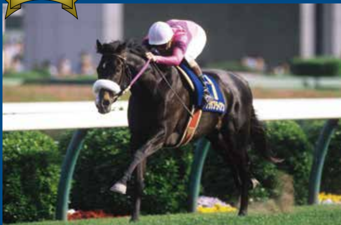
第54回皐月賞 優勝馬 ナリタブライアン