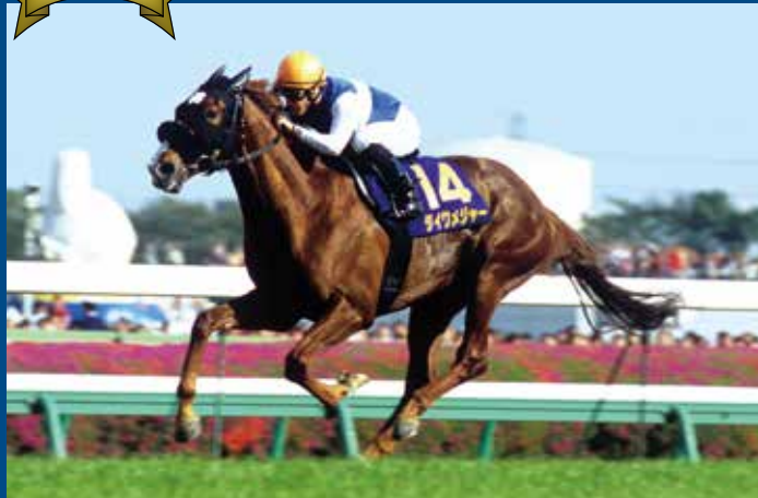
第64回皐月賞 優勝馬 ダイワメジャー