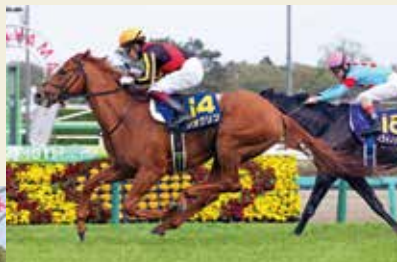
2022年優勝馬: ジオグラフィ

クラシック三冠競走(『皐月賞』・『東京優駿』・『菊花賞』)の第一関門となっており、その中でも「最も速い馬が勝つ」と言われている。なお、第5着までの馬には『東京優駿(日本ダービー)』への優先出走権が与えられる。