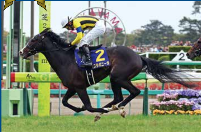
第74回皐月賞 優勝馬 イスラボニータ