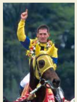
2003年ネオユニヴァース