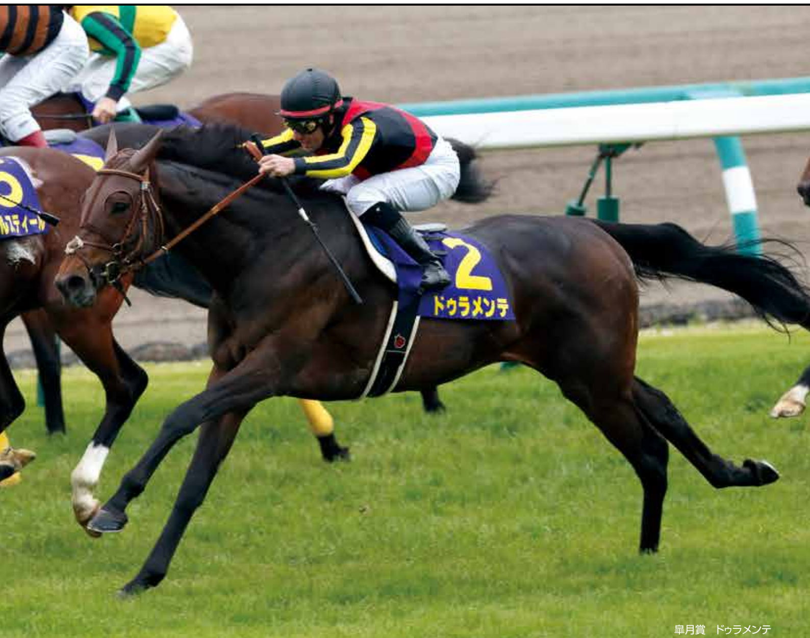
皐月賞 ドウラメンテ