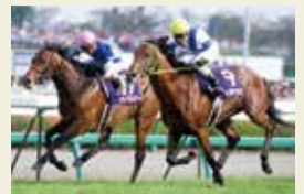
2007年ヴィクトリー(左)