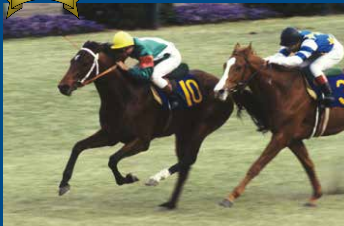
第44回皐月賞 優勝馬 シンボリルドルフ