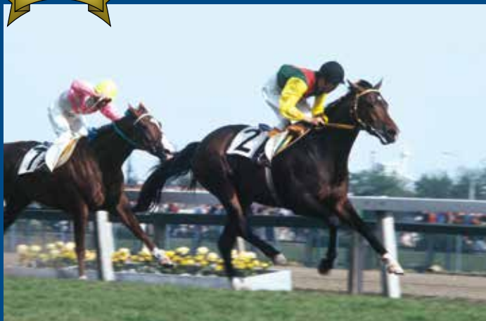
第34回皐月賞 優勝馬 キタノカチドキ