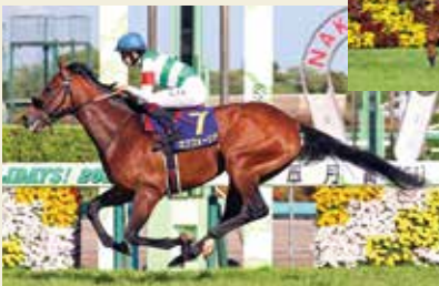
2021年優勝馬: エフフォーリア