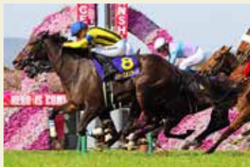
2022年優勝馬:スターズオンアース