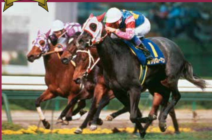
第54回桜花賞 優勝馬 オグリローマン