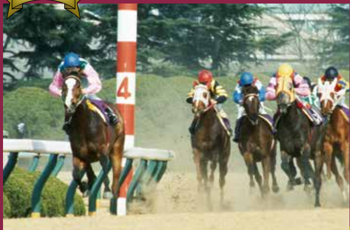
第44回桜花賞 優勝馬 ダイアナソロン