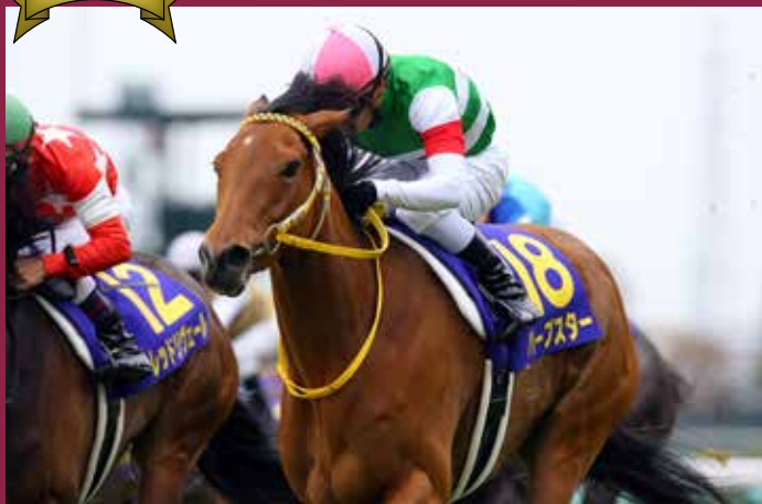
第74回桜花賞 優勝馬 ハープスター