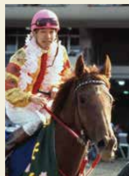
1989年シャダイカグラ