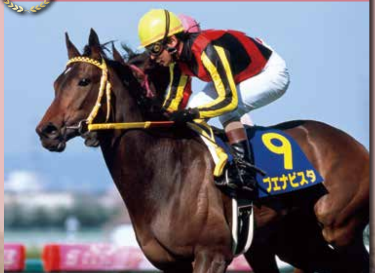
GI馬ピワハイジを母に持つ良血馬で、鮮烈なスパートを見せて2009年の本競走を制した。単勝支持率67.5%は21世紀では最高値。