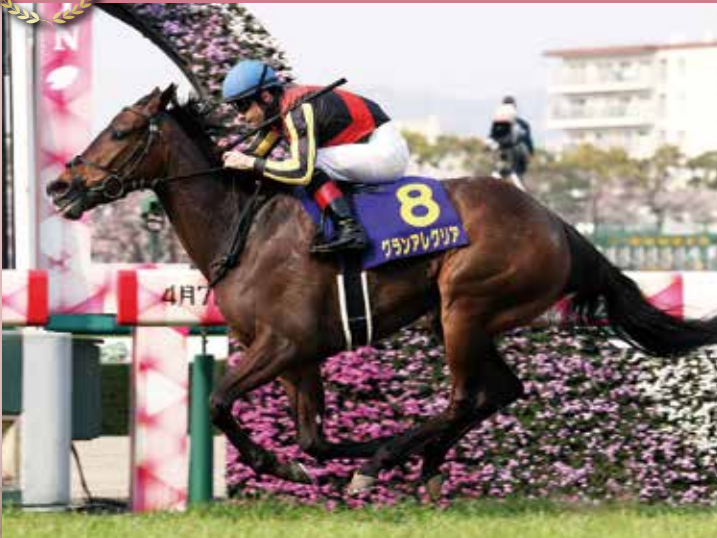
2019年の本競走など芝1600mの距離で圧倒的強さを誇ったマイル女王。桜花賞は前年の朝日杯フューチュリティS(3着)以来というローテーションであった。