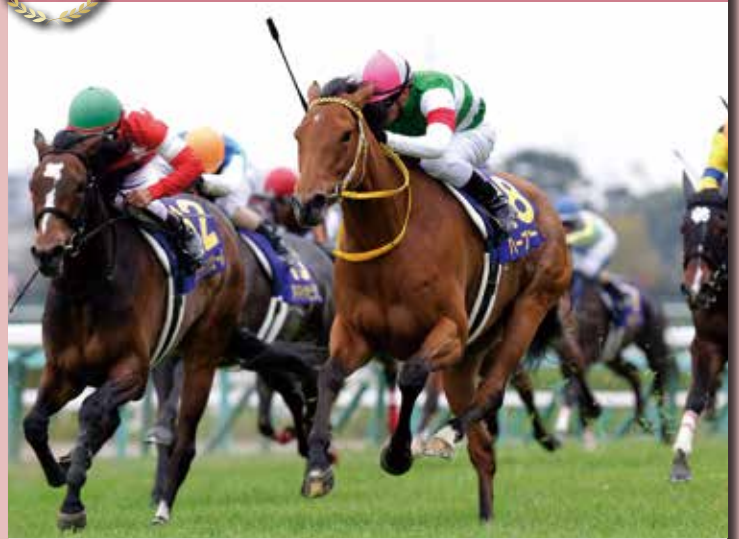
4コーナー18番手から衝撃的な末脚で勝利を収めた2014年の優勝馬。母の母であるベガも1993年に本競走を制している。