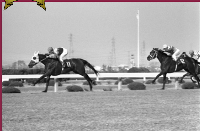
第24回桜花賞 優勝馬 カネケヤキ