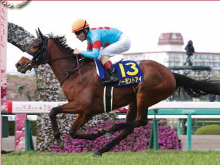
2018年の優勝馬。前走・シンザン記念で重賞初制覇を飾った勢いそのままに2番人気で挑んだ本競走でもラッキーライラックに1馬身3/4差の快勝。