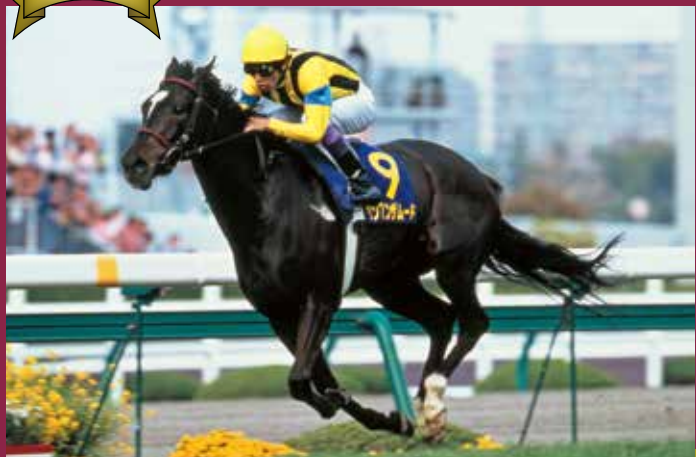
第64回桜花賞 優勝馬 ダンスインザムード